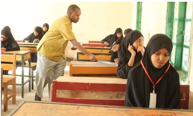
tusmo: arday u diyaar garoobaysa imitixankii fasalka afraad ee loogu gudbo heerka jaamacadda

waxaan haystaa labo shahaado jaamacadeed; Shahaadada koowaad shaybaarka, talabaadna waa caafimaadka guud. Waxaan jeclaan lahaa inaan yeesho takhasus caafimaad si aan u noqdo dhaqatar buuxa. (KQ28 – Waxbarashada Aasaasiga ah ee Bedelka ah/Waxbarashada Dadban (ABE/NFE))